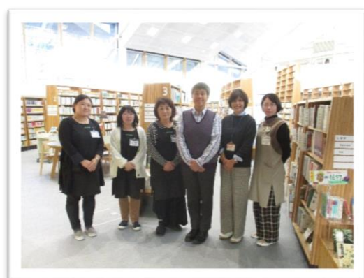
11月に竹田市立図書館にお見えになった小田理事長と図書館職員